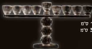
גובה: 16 ס"מ רוחב: 32 ס"מ