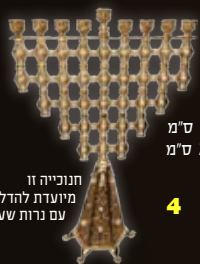
גובה: 30 ס"מ רוחב: 20 ס"מ