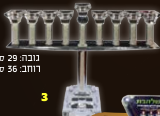
גובה: 29 ס"מ רוחב: 36 ס"מ

חנוכייה זו מיועדת להדלקה עם נרות שעה בלבד