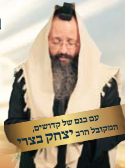
עם בנם של קדושים, המקובל הרב יצחק בצרי

"עניין גדול לביטול כל הדינים ודקות לאדון יחיד ברוך הוא" ("נפש החיים")