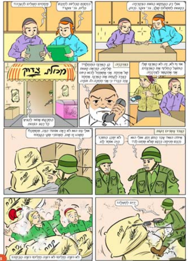
המשך בשבוע הבא...