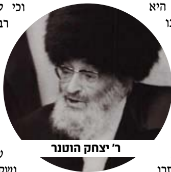
ר' יצחק הוטנר

אומנם נכון הוא שהאם אינה לומדת תורה, ומטבע הדברים תתקשה למלא את תפקידו של האב שסופג לאישיותו, באם הוא לומד, יותר השקפה נכונה. אבל תפקידה מיוחד, שכן בידיה בלבד היכולת להכין את המצע הראוי שייסייע לאב להנחיל לבנו את המורשת הנכונה. במעשיה, ללא מילים, היא מדגישה את החשיבות של העובדה שזכתה לילד שהולך בדרכים נכונות. לדוגמא, כשהילד שב מלימודיו – אם דווקא אז תצליח האם לסגל לעצמה את הנוהג לעזוב את עבודות הבית השוטפות ולהתפנות לבן ששב מלימודיו, להגיש כוס שתייה ממותקת ואולי גם צלחת "עוגיות של אמא" – הדקות הבודדות הללו הן