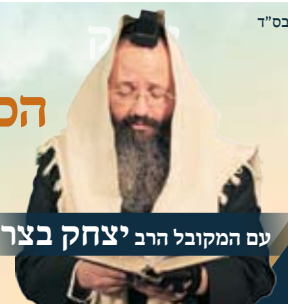
עם המקובל הרב יצחק בצרי

בסוף הערב תינתן אפשרות למשתתפים לקבל ברכה אישית מהרב