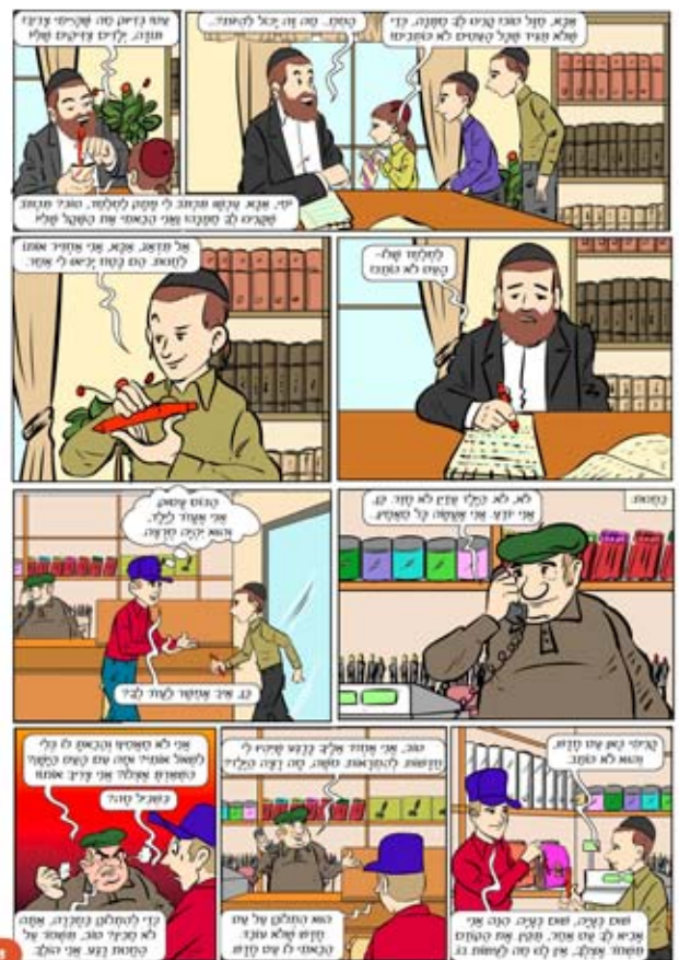
המשך בשבוע הבא...