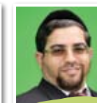
הרב בן סימון