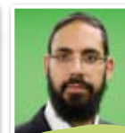
הרב אליהו נקש