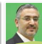
הרב חגי צדוק