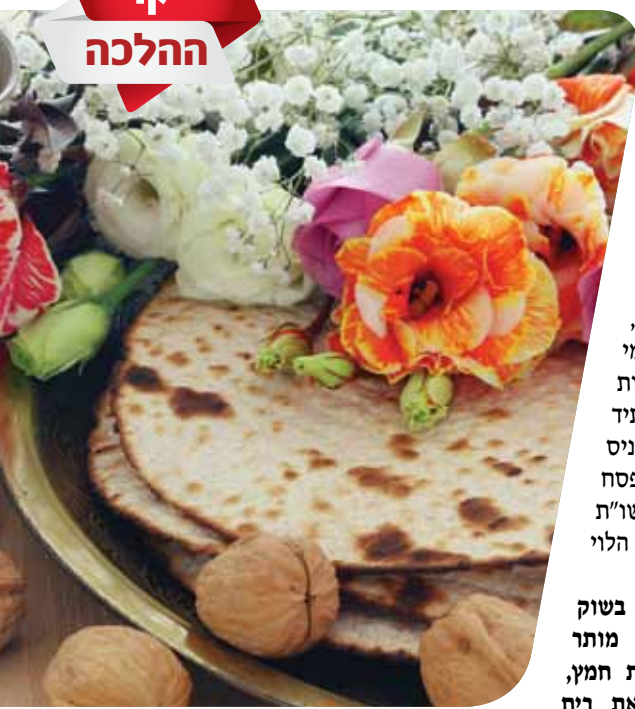
הרב ירון אשכנזי