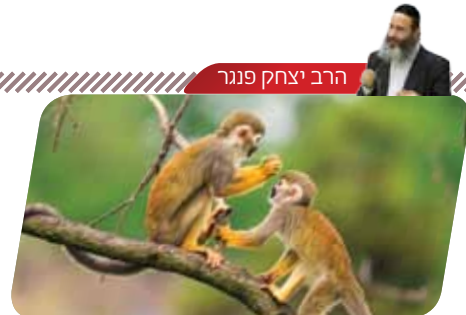
הרב יצחק פנגר