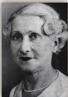
ז'אן לואיז קלמן

ז'אן לואיז קלמן, צרפת. 1875-1997. נפטרה בגיל 122 (יש הטוענים לזיוף°)