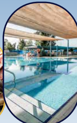
בריכה וחוף נפרד