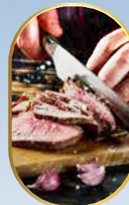
ארוחות חג עשירות