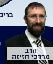
הרב מרדכי חזיקה