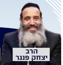
הרב יצחק פנגר