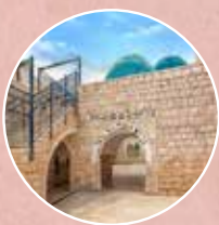
היולת רבי שמעון בר יוחאי