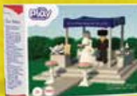
חנות וכלה בחופה