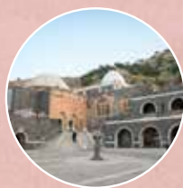
היולת רבי מאיר בעל הנס