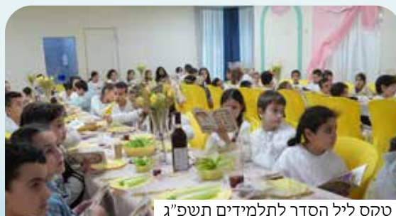
טקס ליל הסדר לתלמידים תשפ"ג

לא תאמינו אבל מתברר שיש, והורים רבים כבר חווים את ההצלחה המסחררת. בית ספר ייחודי עם צוות חם ואכפתי, ערכים ומצוינות, סביבת לימודים תומכת ואוהבת, הצלחה