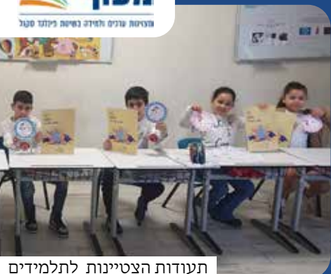
תעודות הצטיינות לתלמידים