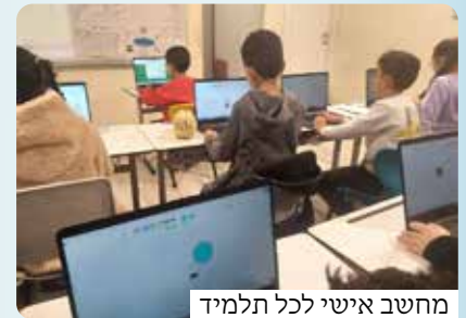
מחשב אישי לכל תלמיד

גם בציוד טכני יש השקעה מרשימה. לימודי מחשב עם מחשב אישי לכל ילד, שיעורי אלקטרוניקה ורובוטיקה מלווים בערכת למידה אישית לכל תלמיד. כל זה הוא חלק ממארג שלם של הקפדה מדוקדקת על כל צעד ושעל של התלמיד בין כתיב בית הספר, מתוך מחשבה עמוקה מה נכון לו, מה טוב לו ומה יעצים אותו.