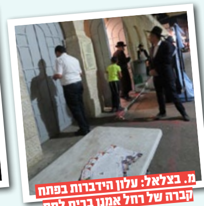
מ. בצלאל: עלון הידברות בפתח קברה של רחל אמנו בבית לחם