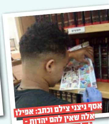
אסף ניצני צילם וכתב: אפילו אלה שאין להם יהדות - לכל אחד יש הידברות