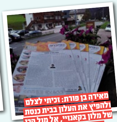
מאירה בן פורת: זכיתי לצלם ולהפיץ את העלון בבית כנסת של מלון בקאנוני, אל מול הרי הדולומיטים שבאיטליה