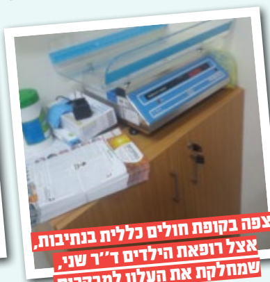
נצפה בקופת חולים כללית בנתיבות, אצל רופאת הילדים ד"ר שני, שמחלקת את העלון למבקרים בחדרה