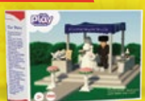
חנות וכלה בחופה