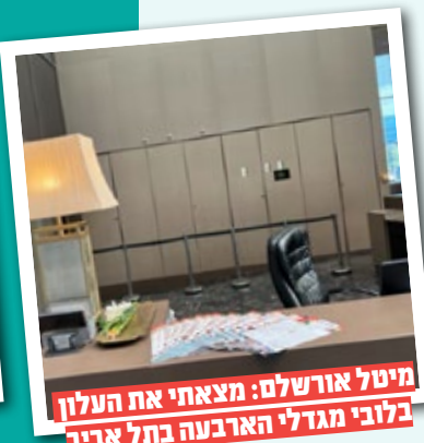
מיטל אורשלם: מצאתי את העלון בלובי מגדלי הארבעה בתל אביב