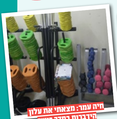
חיה עמר: מצאתי את עלון הידברות בחדר כושר