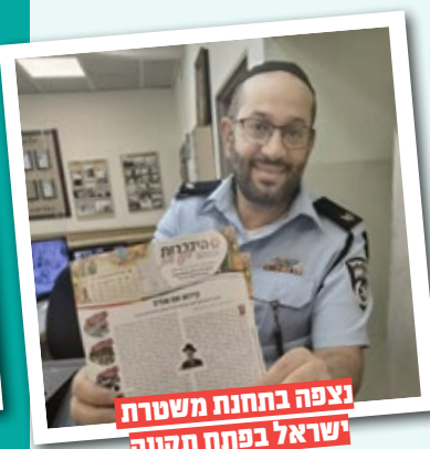
נצפה בתחנת משטרת ישראל בפתח תקווה