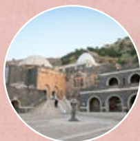
הילולת רבי מאיר בעל הנס

הזמיני ערב הפרשת חלה שמח ועוצמתי במיוחד!