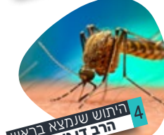
4 הרוחש שנמצא בראש הרב דן טיומקין