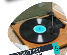
5 שני לנשמה אהרן רזאל