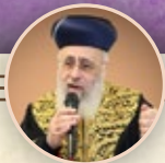
מרן הראשון לציון הגאון הרב יצחק יוסף

"אדם שמזכה את הרבנים - משמייס נותנים לו שפע, ברכה ובריאות יותר ממה שמגיע לו לפי המעשים שלו"