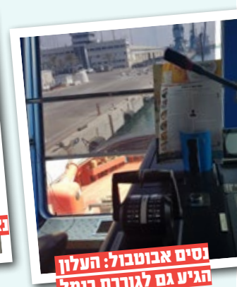
נסים אבוטבול: העלון הגיע גם לגוררת בנמל אשדוד