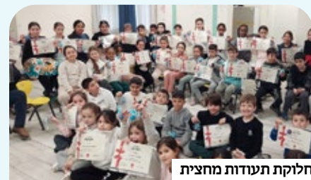
חלוקת תעודות מחצית

הורים רבים מאוד נושאים כאב גדול על ילדיהם. הבעיות הרגשיות וההתנהגותיות מתחילות בגילאים צעירים ביותר, ההתמכרות למסכים נראית כמו גזרה שנאלצים להשלים איתה, וקשיים חברתיים, חרמות ומחסור בתכנים ערכיים מולידים דור שלם שמדאיג הורים ומחנכים כבר יותר מדי שנים. הרב זמיר כהן מדבר בראיון מיוחד על פתרון שמפיח תקווה בלבבות, וכבר הוכיח את עצמו – רשת בתי הספר מבית הידברות: מצוינות, ערכים ולמידה בשיטת פינלנד סקול לילדים שהוריהם אינם דתיים בהכרח.