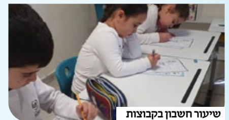
שיעור חשבון בקבוצות

"מדובר במצב חמור. ילדים סובלים מקשיים רגשיים וחברתיים, חלקם מתנהלים ללא כבוד להורים ולזולת משום שאיש אינו מודרך אותך לכן כראוי בבתי הספר, הצימאון לערכים גובר ולא פעם צוותי החינוך עומדים מול שוקת שבורה בלי יכולת לפתור את הבעיה מהשורש. מובן שהתופעות האלו משפיעות על יכולת הלמידה הבריאה, ומתפתחות הפרעות קשב וריכוז שאינן תרומות למצב. ישנם הורים שמשלימים עם המצב הנורא הזה. אלא שישנם מקומות רבים,