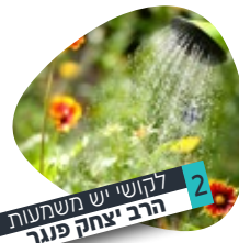
2 לקושי יש משמעות הרב יצחק פנור

ובדורנו, כאשר ביד כל אדם אפשרות שלא היתה קיימת בדורות הקודמים, להשתמש בהיותו בנסיעה בדרכים בכלים הקיימים היום האזנה לשיעורי תורה הנמסרים מאין ספור תלמידי חכמים מובהקים ויראי שמים ובעלי מידות טובות, על אחת כמה וכמה שזכות וחובה קדושה היא לנו לנצל את זמני הדרכים ללימוד תורה, בשיעורי הלכה ומוסר בכל תחומי החיים. וכבר פגשנו אנשים שעיקר פרנסתם מנסיעות בדרכים, כגון נהגי משאיות וכדומה, והם מעידים על עצמם שכל חייהם השתנו לטובה, כאשר החליפו את האזנה לדברי הבל ותוהו שאין בהם שום תועלת, בהאזנה לדברי תורה, ונעשו בעלי ידיעות רחבות בהלכה, בתיקון המידות, בהשקפה