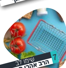
7 שימו לב הרב אהרן מרגלית