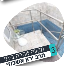
3 מקווה טהרה ביתי הרב ירון אשכנזי