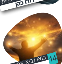
14 באו נביא את השפע מורן קורס

העלון טעון גניזה | נא לא לקרוא במהלך התפילה