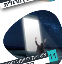
11 אשד"ת החופש האמיתי דודו כהן