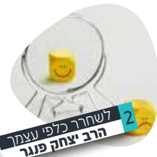
2 | לשחרר כלפי עצמך הרב יצחק פוגר

שהנה יש להבין, מהי התכלית של צרות אלו שלפני ביאת המשיח, ומפני מה לא תבוא הגאולה