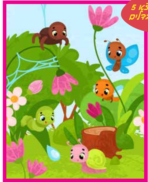
מצאו ההקדים 5