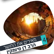
4 | מארים את החושך הרב דן סימקין