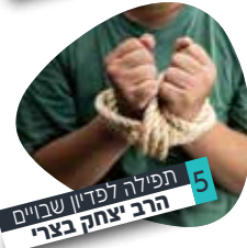
5 | תפילה לפדיון שבויים הרב יצחק בצרי