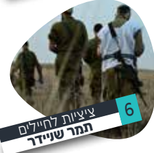
6 | ציטויות לקהילים תמר שניידר