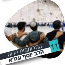
11 | התרחמות הרוח הרב יוסף עזרא