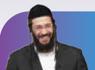
סדרת הרצאות מעולמות ה-NLP הקאנוצ'ר אליהו שירי

מגוון רחב של ערכות דיסק און קי מעוצבים שינגישו לכם תוכן עשיר ערכי ומגוון. המאמצים קומפקטים כך שתוכלו לקחת ולהאזין מכל מקום.