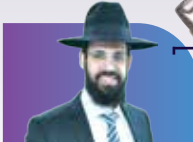
סדנאות והרצאות ייחודיות בנושא זוגיות, חינוך וכו' הרב אליהו נקש