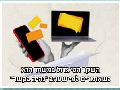
השקד הפי מהזל במשרד הוא פשאומרים למי שעזב "נהיה פקשר"