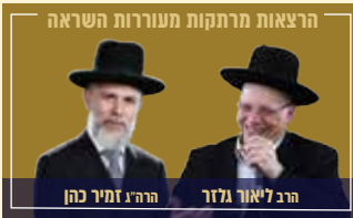
הרצאות מרתקות מעוררות השראה