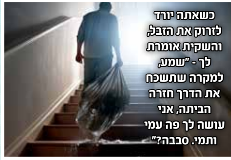
כשאתה יורד לזרוק את הזבל והשקית אומרת לך - "שמע, למקרה שתשכח את הדרך חזרה הביתה, אני עושה לך פה עמי ותמי. סבבה?"