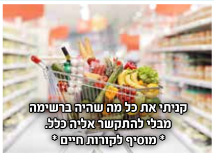
קניתי את כל מה שרירה ברשימה מבלי להתקשר אליה כלל * מוסיף לקורות חיים *