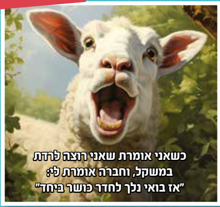
כשאני אומרת שאני רוצה לרדת במשקל, וחברה אומרת לי: "אז בואי נלך לחדר כושר ביחד"