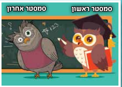
מסטר ראשון מסטר אחרון