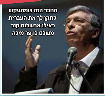
החבר הזה שמתקש לתקן לך את העברית כאילו אבשלום קור משלם לו פר מילה