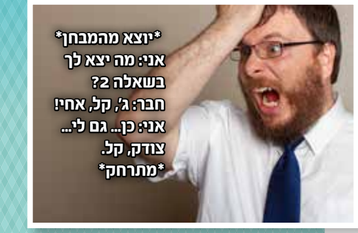
*יוצא מהמבחן* אני: מה יצא לך בשאלה 2? חבר: ג', קל, אחי! אני: כן... גם לי... צודק, קל. *מתרחק*