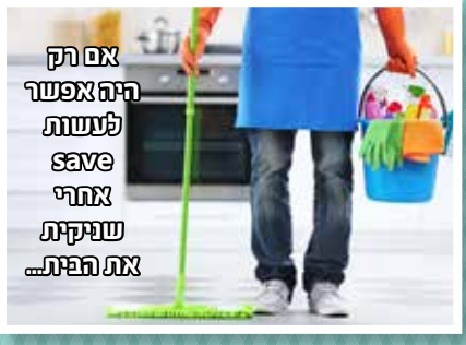
אם רק היה אפשר לעשות save אחרי שניקית את הפית...

? מהכלי - יטול מהמקום הנמוך, ואם הפיה נמוכה יותר מהכלי - יטול דרך הפיה ולא מהכלי עצמו.