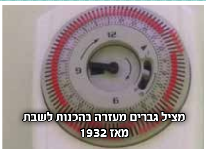
מציל גברים מעזרה בהכנות לשבת מאז 1932

הרגע הזה שאתה לוקח חפיסת שוקולד, בא לשבור שורה אחת, בטעות שובר שתיים, וחושב לעצמך: שאני אתוכח עם הגורל?