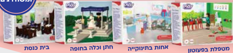
מטפלת בפעוטון | אחות בתינוקיה | חתן וכלה בחופה | בית כנסת

'פיקולה סיטה' הפליימוביל היהודי במגוון מארזים