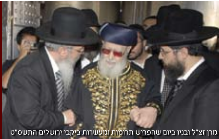
מרוץ צ'ל ובניו ביום שהפריש תרומות ומעשרות ביקבי ירושלים התעס"ט

כזה ראה וקדש "אני בעצמי ביקרתי שם. יין משובה. הכל על פי דיני תורה."