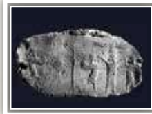
טבעות-חותם עם השם "אחשורוש" שנמצאה בבית האוצר בארמון המלך בפרספוליס. המלך נראה בצד ימין, כתר על ראשו, שתי ידיו מורמות ואוחזות באריות.