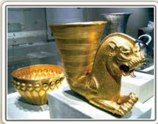
גביע ענק וקערה מזהב, ששימשו לשתיה במסיבות מלכי פרס ומדי

וזהו ביאור הכתוב במגילה "והשתיה כדת - אין אונס": "והשתיה כחוק החדש - שאין להכריח לשתות".