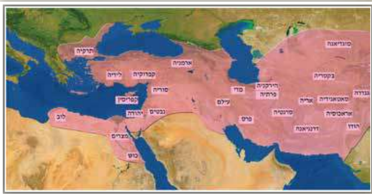
האימפריה הפרסית בתקופת אחשוורוש במפה מופיעות המדינות העיקריות. כוש היתה מדינה בגבול מצרים, כיום בסודאן וסביבותיה.

מקדימים ונותנים עכשיו, מתנות לאביונים 073-222-12-12