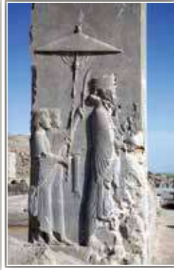
המלך הפרסי חשיארש הראשון, הוא אחשורוש. בתבליט שנמצא בחורבות ארמונו בפרספוליס. למלכי פרס היו ארמונות ענק במספר ערים.

מגילת אסתר פותחת בזיהויו של המלך שבתקופתו התרחשו המאורעות הכתובים בה, והיא מציינת את גבולתיה של ממלכתו.