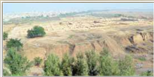
שרידי ארמון אחשוורוש בשושן, כיום. נבנה על גבי רֶקָה גבוהה.