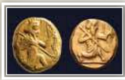
מטבעות זהב בשם אדרכמן, או אדרכון, שהיו בשימוש בפרס בזמנם של אחשורוש ודריוש. משמעות השם היא "דורך קשת". על המטבע מוטבעת דמות המלך עם קשת, חיצים וחנית.

היוונים כינו את חשיארש בשם כֶּסְרֶסְסֶס הראשון, כהרגלם לשנות שמות ולהשתמש רבות באות ס' בשפתם. באמצעות זיהו זה ניתן לשאוב ידיעות