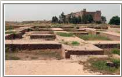
מראה חלקי של שרידי קירות ארמון אחשוורוש בשושן, כיום. הבניין הגבוה מימין נבנה על ידי הארכיאולוגים, למגוריהם.