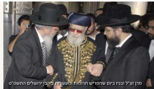
מרן זצ"ל ובניו כיום שהפריש תרומות ומעשיות ביקני ירושלים התשס"ט

"אני בעצמי ביקרתי שם. יין משובח. הכל על פי דיני תורה."