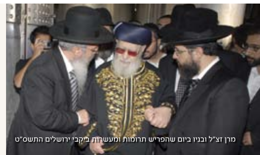
מרן זצ"ל ובניו ביום שהפריש תרומות ומעשיות ביקני ירושלים התשס"ט

"אני בעצמי ביקרתי שם. יין משובח. הכל על פי דיני תורה."