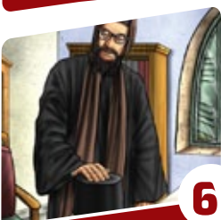
סיפורי צדיקים לילדים

ומה יעשה להינצל מסכנה חרדתית זו? על ידי שירגיל עצמו לחשוב תמיד כי המדד למעלותיו הוא איך הוא נראה בעיני הבורא ולא בעיני בני אדם, וכך לבטל את התלות בהם. זאת ועוד שלם בינו לבין עצמו, בינו לבין בוראו, ובינו לבין זולתו. את זאת משיגים על ידי שלושת העמודים שעליהם העולם עומד: תורה, עבודה (קרבנות, וכיום - תפילה), ו גמילות חסדים . התורה - מאירה את נשמת האדם הלומד אותה באור פנימי אלוקי, חושפת בפניו את סודות טבע הבריאה מהצד הרוחני שלהם, שזהו בעצם סוד המצוות, וגם מחכימה את האדם בכל חכמות העולם. לפיכך לימוד התורה ממלא את האדם ומביא אותו להיות שלם בינו לבין עצמו.