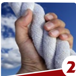
מדוע צדיקים נהרגו?

10% מאוכלוסיית בעולם סובלים מחרדות חברתיות. מחקרים הוכיחו, כי עיקר הגורם לחרדה חברתית הוא הצורך של הסובל להוכיח את עצמו. שהוא מוצלח, שהוא בסדר גמור, שהוא חכם, שהוא נראה טוב, וכך בשאר עניינים החשובים בעיני הבריות. חרדה זו גורמת לאותו אדם לחוש מגורש מהחברה והסביבה, וממילא להתנהלות ירודה שסבל רב כרוך בה.