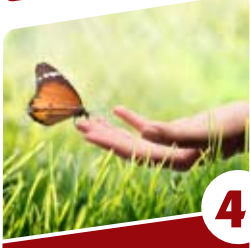
4 קנה לך "חבר"