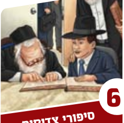
6 סיפורי צדיקים לילדים

אמר לה: "השמעי לי" (דבר עבירה). הוציאה יראתה (פסל שאליו היא עובדת) מתוך חיקה, ואמרת לו: "עבוד לזה!", אומר לה: "הרי יהודי אני", אומרת לו: "זימה אכפת לך? כלום מבקשים ממך אלא פיעור" (עבודה זרה בדרך של כללוק), כיון שפוער, אומרת לו: "אין אני מניחתך עד שתכפור בתורת משה רבך".