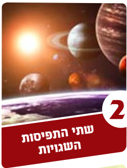
2 שתי התפיסות השגויות

ובשעה שישראל אוכלין ושותין ושמחין ויוצאין לטייל בשוק, זקנה אומרת לו: "אתה מבקש כלי פשתן?" זקנה אומרת לו בשווה (במחיר הנכון), וילדה בפחות (והצעירה שבפנים מציגה ומוכרת לו את הכלים במחיר הנמוך מהשווי האמיתי), שנים ושלשה פעמים. מכאן ואילך אומרת לו, "הרי אתה כבן בית. שב וברור לעצמך". וצרצורי (כדים) של יין עמוני מונח אצלה. ועדיין לא נאסר יינן של נכרים. אמרו לו: "רצונך שתשתה כוס של יין?" כיון ששתה, בער בו.