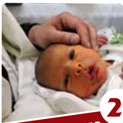
2 ברית המילה למה? בגיל כל כך מוקדם?