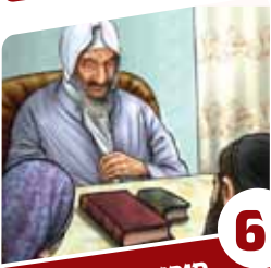
6 סיפורי צדיקים לילדים

עולות, והן מיסוד האש. ולפיכך צירופן יוצר את המילה 'אש' (אלא שהאות ש' מייצגת אש הכרוכה בחומר, ונראית כמו שלהבת הבוקעת מהעצים המונחים למטה, ואילו האות א' מייצגת אש רוחנית, ולפיכך שלהבותיה פורצות גם מעלה וגם מטה. שהרי היא בבחינת 'אלופו של עולם' וכמו שהרחבנו בספר 'הצופן'. ומאחר שאצל המקנא בוערת האש ברוחו, מופיעה דווקא האות א' בשורש המילה).