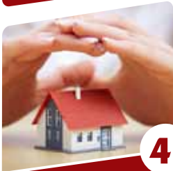
4 בנתה ביתה חוכמת נשים