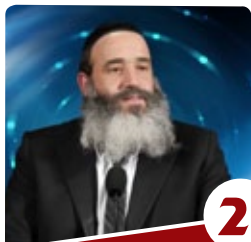
2 הרב יצחק פנגר על סוד ההכנעה

רבנו מתפלל ומבקש מה' לרפא את דיבורו למען גאולת ישראל - היה נרפא מיד. אך כיוון שלא התפלל על הדבר, נשאר ערל שפתיים. ועוד מצאנו שנאמר בפקידת רחל אמנו ע"ה "וַיִּזְכֹּר אֶל-לְהִים אֶת רַחֵל, וַיִּשְׁמַע אֱלֹהִים אֶל-לְהִים, וַיִּפְתַּח אֶת רַחֲמָהּ" (בראשית ל, כב). וביאר האור החיים הקדוש שם, וזו לשונו: "וַיִּזְכֹּר אֶל-לְהִים, כאומר הכתוב כי הגם שעלה זכרונה לפניו, עוד הוצרכה לתפילה, כאומר וַיִּשְׁמַע אֱלֹהֶיךָ". כלומר, אף שעלה זכרונה של רחל לפני ה' והגיע העת לפוקדה בילדים, בכל זאת רק על ידי שהתפללה וביקשה להיפקד - נפקדה.