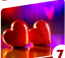
7 הרבנית ימיה מזרחי הסוד של ט"ו באב

מצאנו יסוד גדול זה בשני מקומות. האחד, כאשר התגלה ה' יתברך למשה רבנו בסנה ומשה סירב ללכת בטענה כי הוא ערל שפתיים, הלא יש להבין: מדוע לא ריפאו הקב"ה אלא רק אמר לו "וְאָנֹכִי אֶהְיֶה עִם פִּיךָ וְהוֹרִיתִיךָ אֲשֶׁר תְּדַבֵּר?" על כך כותב הרמב"ן (שמות ד, י) כי אמנם משה רבנו טען: "אל תצונוי שאלך, כי לא ייתכן לאדון הכול לשלוח שליח ערל שפתיים למלך עמים". אולם "הקב"ה, כיון שלא התפלל בכך, לא רצה לרפאותו!" הרי שאילו היה משה