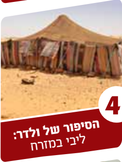
4 הסיפור של ולדר: ליבי במזרח