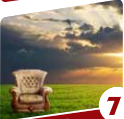
7 ימימה מזרחי אבודה הרבנית