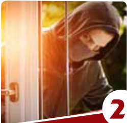
2 הרב יצחק פנוגר מאיפה הדחף להיטיב?

כאשר האדם מנצח בקרב על היצר הרע, הוא מחזיר לעצמו את השליטה בדחפים וברצונות הפועמים בתוכו, ובכך הוא הופך לבן חורין אמיתי המכתיב לעצמו את סדרי העדיפויות וניתוב הכוחות לטובה. אדם כזה זוכה לחיים נכונים וטובים, גם בעולם הזה וגם בעולם הבא. שבת שלום.