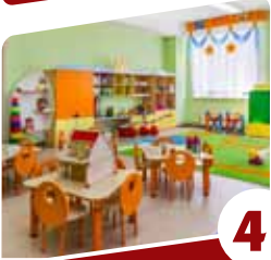
4 הסיפור של ולדר הגנת