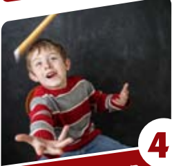
4 הסיפור של ולדר המסעל הקטן של חיי