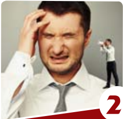
2 הרב יצחק פנגר כולנו אלופים בביקורת

האם יש דרך לשמחה בכל עת ובכל מצב? שני פסוקים בפרשה מנגלים לנו שהתשובה לך חיובית