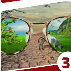
3 הרב יצחק פנגר עניין של הסתכלות