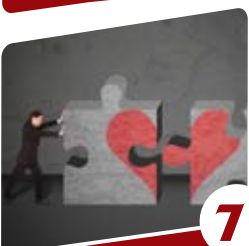
7 יקומה מזרחי מלחיסה למחילה הרבנית

זוהי ההסתכלות הנכונה: אם על פי ההלכה אסור לעבור לפני אדם המתפלל, הרי שיש כאן קיר!