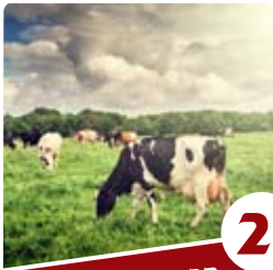
2 הרב דניאל בלס המופת שבדיני השחיטה