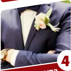
4 הסיפור של ולדר החליפה