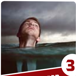
3 הרב יצחק פנגר השלב הבא: המתקה

אולם משה רבנו ביקש להיכנס לארץ על מנת להתקדש בקדושתה בהיותו שוכן בתוכה, ולקיים בה את המצוות התלויות בה. על כך הרבה להתפלל חמש מאות וחמש עשרה תפילות כדי להיכנס אליה, כמובא אלה, והשיב לו הקב"ה כי אמנם לא יוכל להיכנס לארץ, אבל על כל פנים יעלה להר נבו לראותה, ועל ידי הראייה ייווצר סוג של חיבור בינו לבין ארץ ישראל, ויקבל בכל זאת דבר-מה מקדושתה. למדים אנו מכך יסוד גדול: הראייה אינה ענין חיצוני, כפי שסבורים רבים, אלא יש בה ממד של מגע ממש מסוים. ומכאן מוסר השכל גדול לעצמנו עד כמה יש לשמור על קדושת העין, ולא יאמר האדם לעצמו 'איני נוגע חלילה במה שאסור אלא רק מסתכל בו', אלא יידע שההסתכלות יוצרת מגע בין נשמת האדם לבין מה שמביט עליו, הן הטובה והן חלילה לרעה. ולפיכך אמר הנביא ישעיהו (ל, 5): "וְהָיוּ עֵינֶיךָ רְאוּת אֶת מוֹרֶךְךָ". לפי שההסתכלות בצדיקים מועילה למסתכל משום היותה יוצרת חיבור בין נשמת המסתכל לנשמת הצדיק, ומאידך הזהירו ואמרו: "אסור להסתכל בפני אדם רשע" (מגילה כח ע"א).