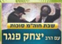
שבת תורה'מ סוכות עם הרב יצחק פנגר