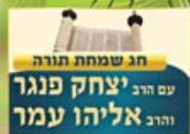
חג שמחת תורה עם הרב יצחק פנגר והרב אליהו עמר